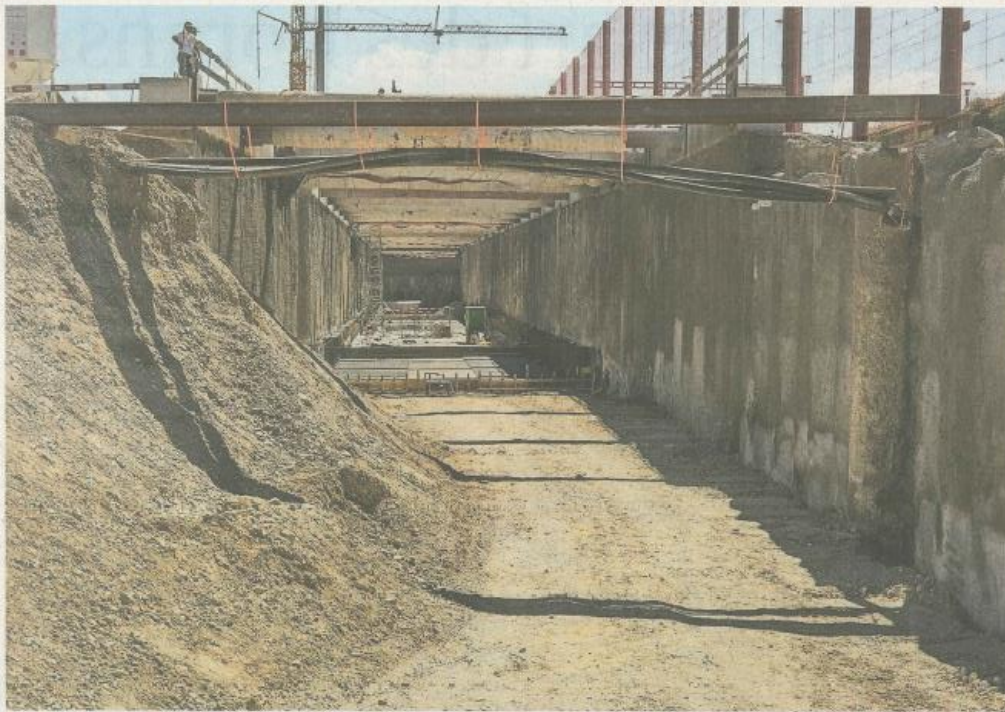
Der Tagbautunnel Bahnhof befindet sich noch im Rohbau. Das Trassee zum Tunnel soll bis Ende 2016 fertiggestellt sein.