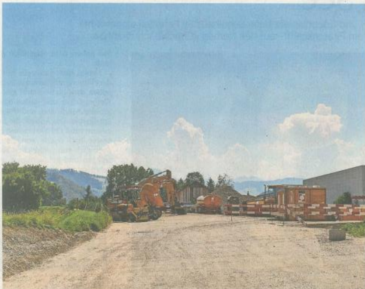
Wetterpech oder -glück? Die rund einstündigen Baustellenbegehungen fanden in brütender Hitze statt.