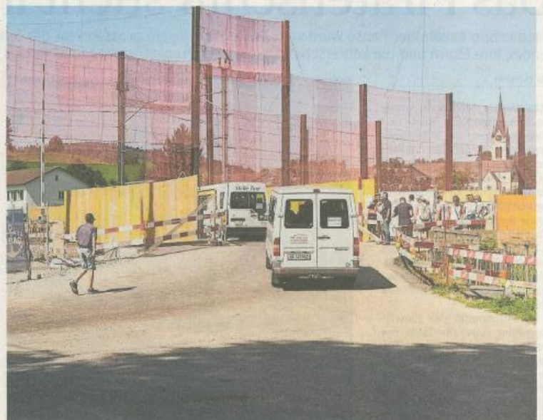
In Kleinbussen fahren die rund 1000 Interessenten zu zwei Ausgangspunkten der Baustellenbegehung.