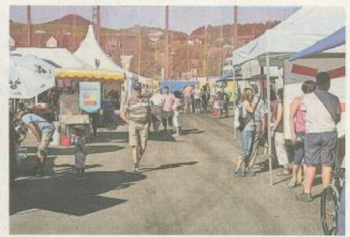
Vereine machten aus dem Soorpark-Areal ein Volksfestgelände.