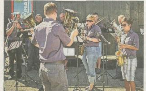
Auch die Musikgesellschaft Ganterschwil spielte auf.